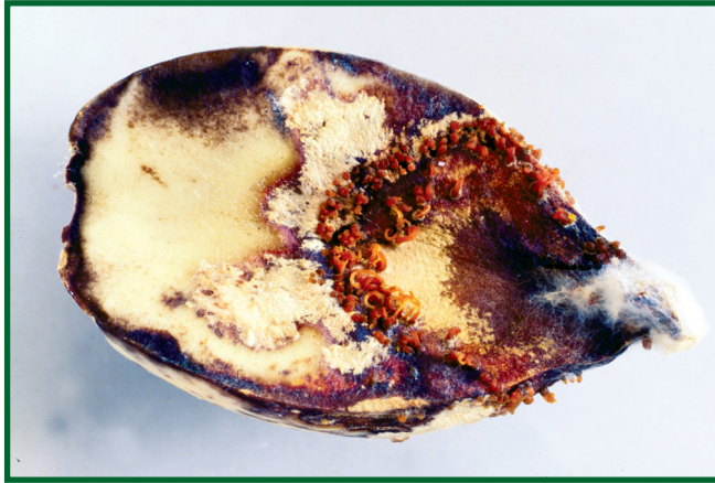
Obr. 5: Phomopsis sp. na žaludu.