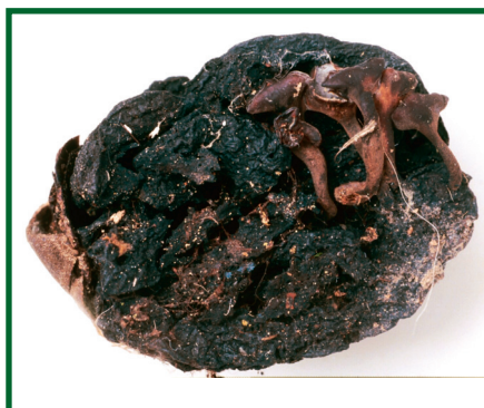
Obr. 1: Teleomorfní plodnice hlízenky žaludové na mumifikovaném žaludu.

K primární nákaze žaludů dochází v lese, kde se houba vyvíjí na starých infikovaných žaludech s dělohami přeměněnými na pseudosklerocia