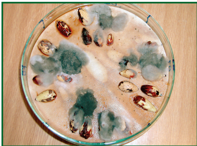
Obr. 8: Zdravotní rozbor vzorku žaludů.