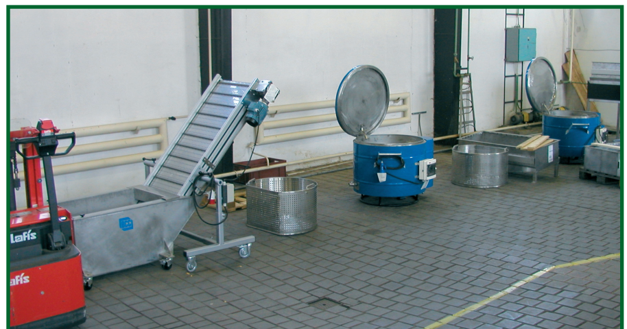
Obr. 7: Zařízení na termoterapii žaludů.

Zatím jediným prostředkem, který zachrání a vyléčí žaludy již infikované hlízenkou, je termoterapie . Principem termoterapie je působení teploty, která je letální pro patogena, ale neovlivňuje klíčivost a vitalitu semen. V praxi se používá máčení semen v teplé vodě nebo jejich vystavení účinku horké páry (obr. 7). Máčení je považováno za účinnější, protože se předpokládá, že účinek teplé vody je zesílen působením vyluhovaných fenolových látek a tríslovin. Kri-