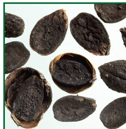
Obr. 4: Mumifikované žaludy.