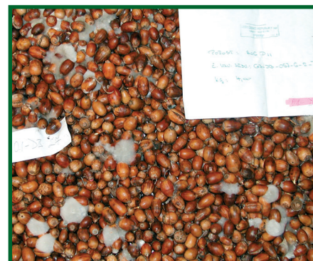
Obr. 2: Vyvíjející se mycelium hlízenky na skladovaných žaludech.

K sekundární nákaze žaludů dochází během skladování, kdy se infekce šíří vzdušným myceliem vyvíjejícím se na napadených žaludech (obr. 2).