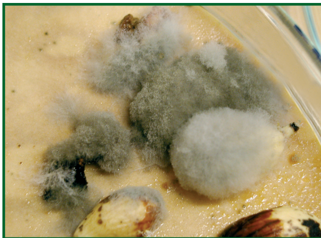
Obr. 9: Růst mycelia hlízenky z infikovaných žaludů během zdravotního rozboru.

tická teplota pro žaludy dubu letního a zimního, nad kterou dochází ke snížení jejich klíčivosti, je 42 °C po dobu 10 hodin, 44 °C/8 hodin nebo 46 °C/4 hodiny. Při termoterapii dochází současně s usmrcením hlízenky žaludové i ke zničení dalších hub – např. druhu Discula umbri-nella . Po aplikaci termoterapie se ale na žaludech objevují ve větším množství saprofytické houby (např. zástupci rodu Penicillium a řádu Mucorales ), které nejsou citlivé k působení aplikovaných teplot (termotolerantní). Parazitická aktivita těchto hub je téměř nulová nebo velmi nízká, ale přesto je vhodné po termoterapii namořit žaludy fungicidem (např. thiramem, benomylem) nebo přidat fungicid do vody použité pro termoterapii. V kombinaci s termoterapií se jeví jako perspektivní i aplikace některých biopreparátů (např. přípravky na bázi Trichoderma virens , Clanostachys rosea , Streptomyces griseoviridis , Trichoderma polysporum + T. harzianum a Pseudomonas chloraphis ).