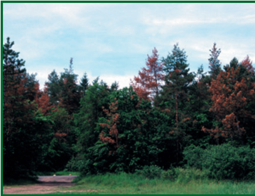
Prosychající porost borovice ( P. sylvestris ) napadený houbou C. ferruginosum