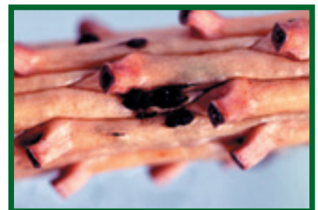
Plodnice (pyknidy) A. abietina na smrku ( P. abies )