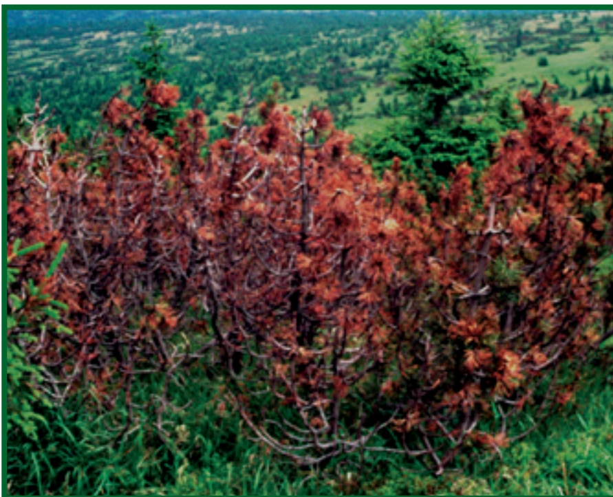
Prosychající porost borovice ( P. mugo ) napadený houbou A. abietina

Miskovité plodnice vřeckatého (pohlavního) stadia - teleomorfy A. abietina jsou v průměru drobnější (0,5–1,5 mm) než u C. ferruginosum (1–3 mm). Teleomorfa A. abietina bývá u nás častěji nalézána pouze na kleči - na borovici lesní i černé byly zatím nalézány prakticky výhradně pyknidy