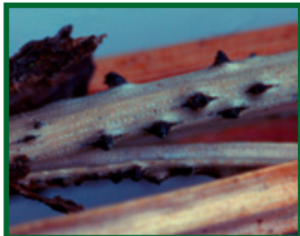
Plodnice (pyknidy) S. sapinea na jehlicích borovice ( P. jeffreyi )

Ascoalex abietina (Lagerb.) Schläpfer-Bernhard má pyknidy víceméně kulovité až mírně