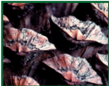
Plodnice (pyknidy) S. sapinea na šupinách šišky borovice ( P. heldreichii )