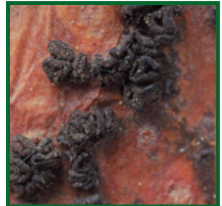
Vřeckaté plodnice C. ferruginosum na borovici ( P. sylvestris )