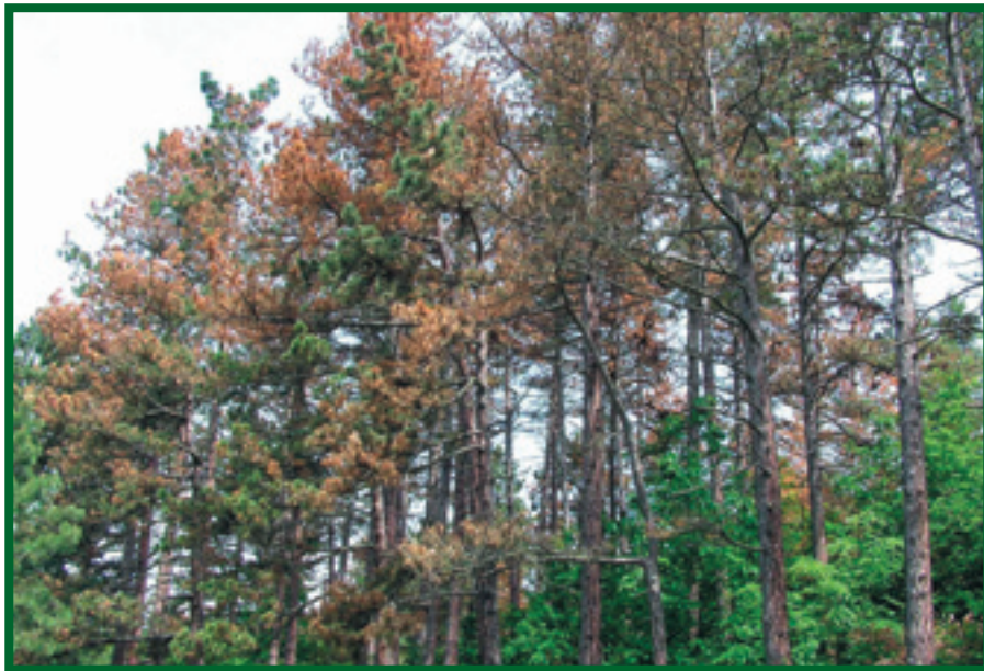
Prosychající porost borovice ( P. nigra ) napadený houbou S. sapinea

anamorfního stadia. Výrazně odlišné jsou i askospory: u A. abietina jsou protáhle oválné, vícebuněčné, bezbarvé, 14–20 x 3–5 µm velké, zatímco u C. ferruginosum oválné, jednobuněčné, bezbarvé, 11–15 x 5–7 µm velké.