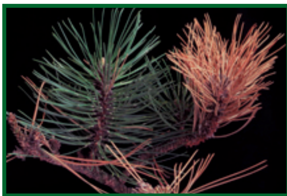
Usychající větev borovice ( P. nigra )

Na odebraném materiálu jsme téměř výhradně našli 3 druhy hub: Ascoalex abietina (Lagerb.) Schläpfer-Bernhard, Cenangium ferruginosum Fr. a Sphaeropsis sapinea (Fr.) Dyko et Sutton. Přiležitostně zjištěný výskyt dalších potenciálních houbových patogenů (dřevokazné houby, sypanky) byl v naprosté většině zkoumaných případů nevýznamný.