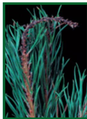
Odumřelý výhon sazenice borovice ( P. sylvestris ) v důsledku infekce houbou S. sapinea

Na napadených větvích nebyl výjimkou výskyt 2 (výjimečně i všech 3) druhů hub na jedné zkoumané borovici, avšak zcela jednoznačně dominantní byla Sphaeropsis sapinea , kterou jsme zjistili ve více než 90 % prošetřovaných případů. Z dvou zbývajících hub jsme při našich šetřeních A. abietina častěji našli na borovicích černých rostoucích ve vyšších, chladnějších polohách (podhůří), zatímco houba C. ferruginosum vyrůstala (ať již sama nebo častěji ve společnosti S. sapinea ) na mladších borovicích černých.