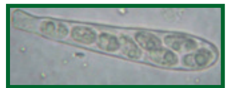
Vřečka s výtrusy C. ferruginosum

oválné, zatímco pyknidy S. sapinea jsou spíše kuželovité. Zcela rozdílné jsou i výtrusy: konidie A. abietina jsou přehrádkované, bezbarvé až světle šedé, srpkovitě až esovitě prohnuté, většinou 30–50 x 2–3 μm velké; zatímco konidie S. sapinea jsou zcela odlišné: jednobuněčné či dvoubuněčné, zralé tmavě hnědé, válcovité až oválné, většinou 25–40 x 10–16 μm velké (více k houbě A. abietina viz např. Soukup, Pešková 2001). Teleomorfa (pohlavní stadium) A. abietina vytváří mističkovité (terčovité) plodnice stejně jako houba C. ferruginosum (ty jsou poněkud větší).