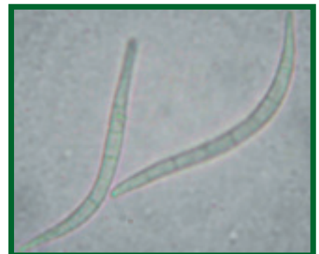
Konidie A. abietina